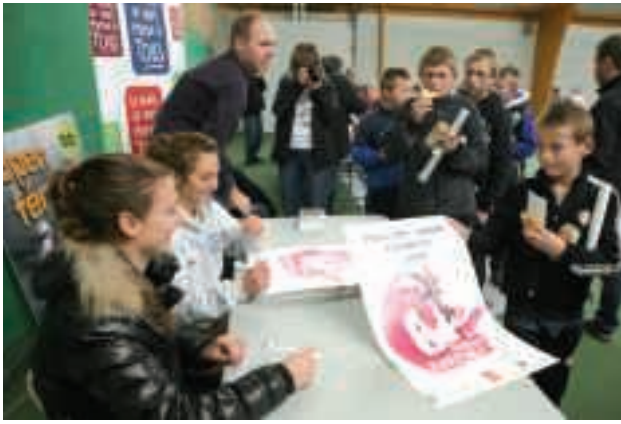
4 > Grand angle