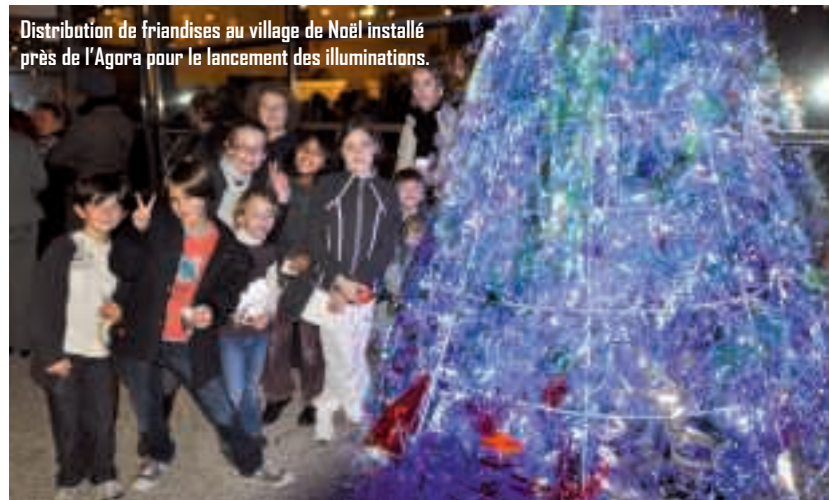
Distribution de friandises au village de Noël installé près de l'Agora pour le lancement des illuminations.

Puis de multiples animations de Noël se sont égrenées avant la date fatidique... Les ateliers cuisine de fête à l'EHPAD, le fameux et très prisé Noël enchanté du C'Jeune et du comité des fêtes, le repas de Noël de l'EHPAD, le spectacle du pôle enfance, le repas de Noël dans les restaurants scolaires, la soirée de fin d'année des maisons de quartier et la visite du père Noël en personne aux bébés nageurs du centre aquatique... La symphonie de Noël était cette année... fantastique !