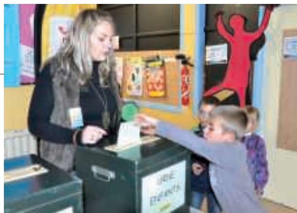
Dans le cadre du concours d'affiches sur les Droits des Enfants, adultes et enfants sont venus exprimer leurs suffrages. 30 affiches ont ensuite concouru au niveau national.

Organisée par la Ville et les Francas, en partenariat avec des associations œuvrant dans les domaines de l'éducation, de la culture ou de l'enfance, cette opération s'inscrit dans la dynamique de projets autour du Temps de l'Enfant initiée par la Ville depuis 2001. Venus en famille ou avec les structures "Petite enfance", les écoles ou les centres de loisirs, près de 1 000 petits ont poussé les portes de l'école Guérault, transformée en véritable cité des enfants! Temps éducatif, de partage et de loisir, cette manifestation est aussi un lieu de rencontre avec les familles. "Suite à cette Semaine de l'Enfance, nous allons expérimenter ou développer de façon pérenne de nouvelles activités à destination des enfants, en continuant à impliquer parents, éducateurs et associations dans nos projets" explique le maire Bernard Cauvin.