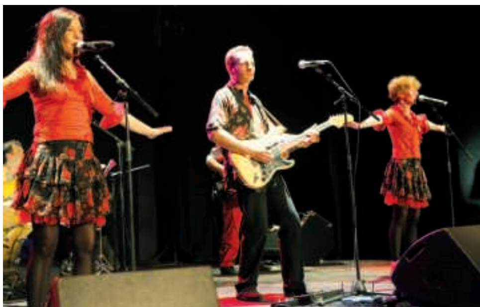
C'est le rockeur pour enfants Roger Cactus qui sera la star du Festival 2012.

Pop-rock pour enfants, humour, musiques du Monde : en 2012, l'Agora revendique à nouveau son éclectisme ! Pour connaître le programme de l'Agora, vous pouvez consulter le site internet de la Ville ou vous abonner à la lettre d'information par mail, sur www.equeurdreville.com , à la rubrique "Agora".