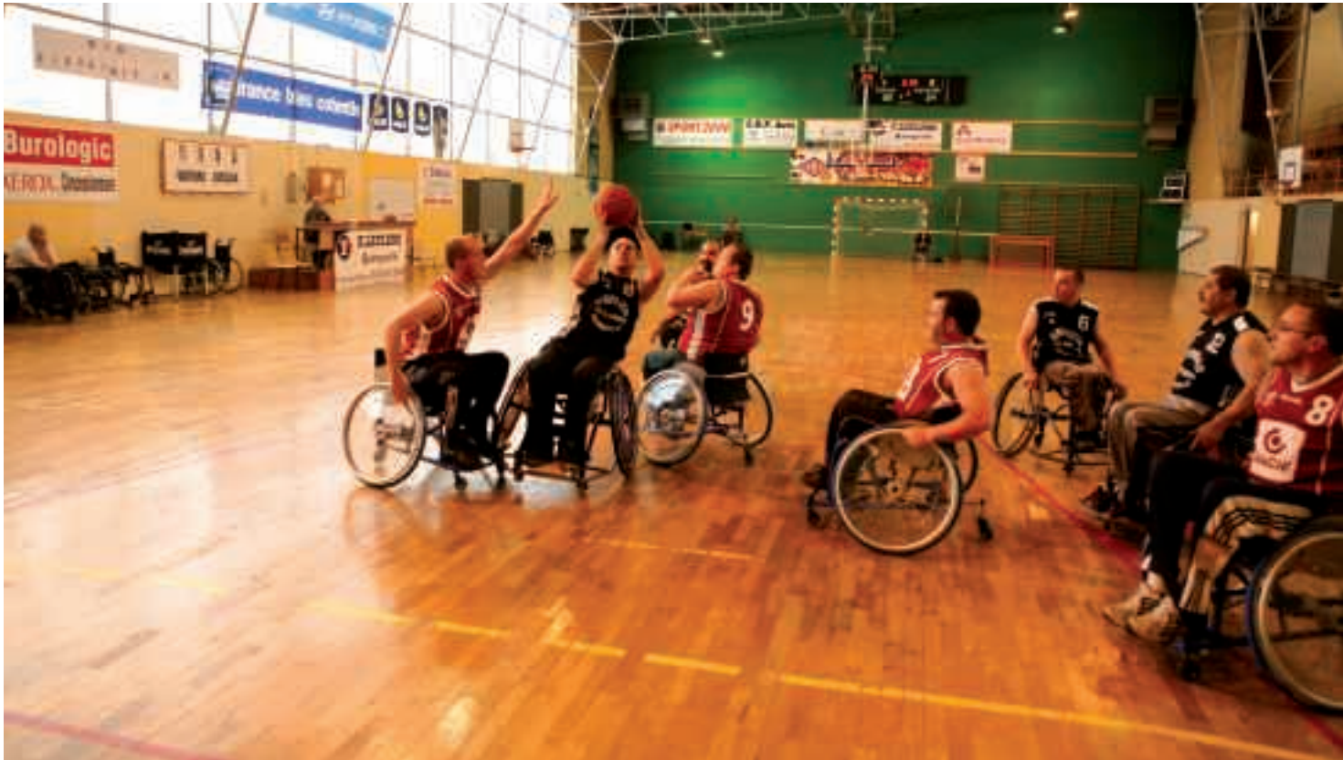
Plusieurs clubs sportifs de la ville disposent à présent de sections pouvant accueillir des personnes en situation de handicap.

➤➤➤ Le Baladin, un véhicule adapté, est mis à disposition par la Ville pour emmener des personnes à mobilité réduite à des animations.