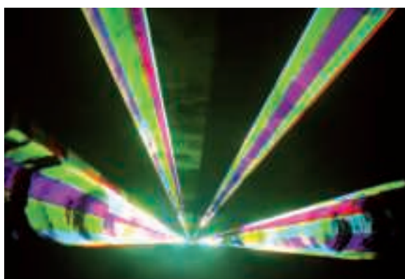
Féerie laser au lancement des illuminations : c'était Star wars à l'Agora !

→ Tout a débuté le mardi 6 décembre à l'Agora. Après le traditionnel lancement des illuminations sur la ville, plus de 1 300 personnes ont assisté au sidérant spectacle de la compagnie "Laser émotion". Puis petits et grands ont pu déguster quelques douceurs de Noël distribuées par des membres du Comité des Fêtes d'Equedreuil-Hainneville et du Comité des fêtes secteur Ouest. Le tout dans un village de Noël constitué de chalets et décoré d'un magnifique sapin qu'avaient confectionné les participants aux ateliers arts plastiques des Bains douches.