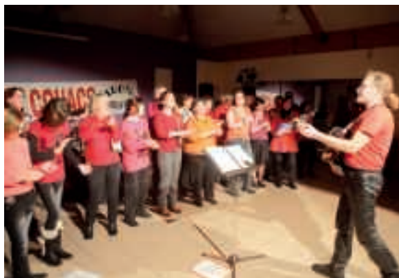
Soirée de fin d'année des maisons de quartier le 16 décembre au Puzzle avec la chorale "L'air de rien".