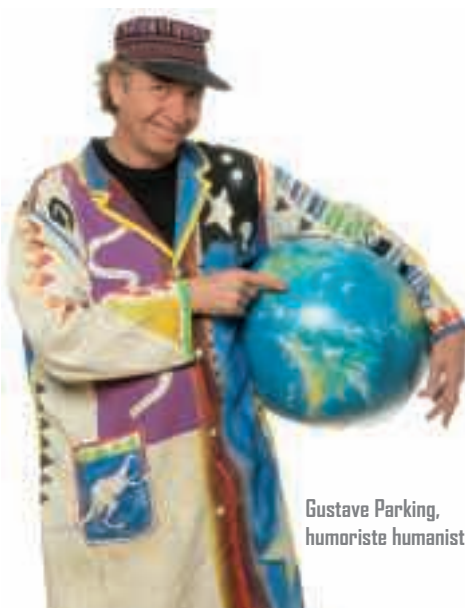
Gustave Parking, humoriste humaniste.

Tarif : 20 €. Places assises. Tél. 02 33 53 96 45