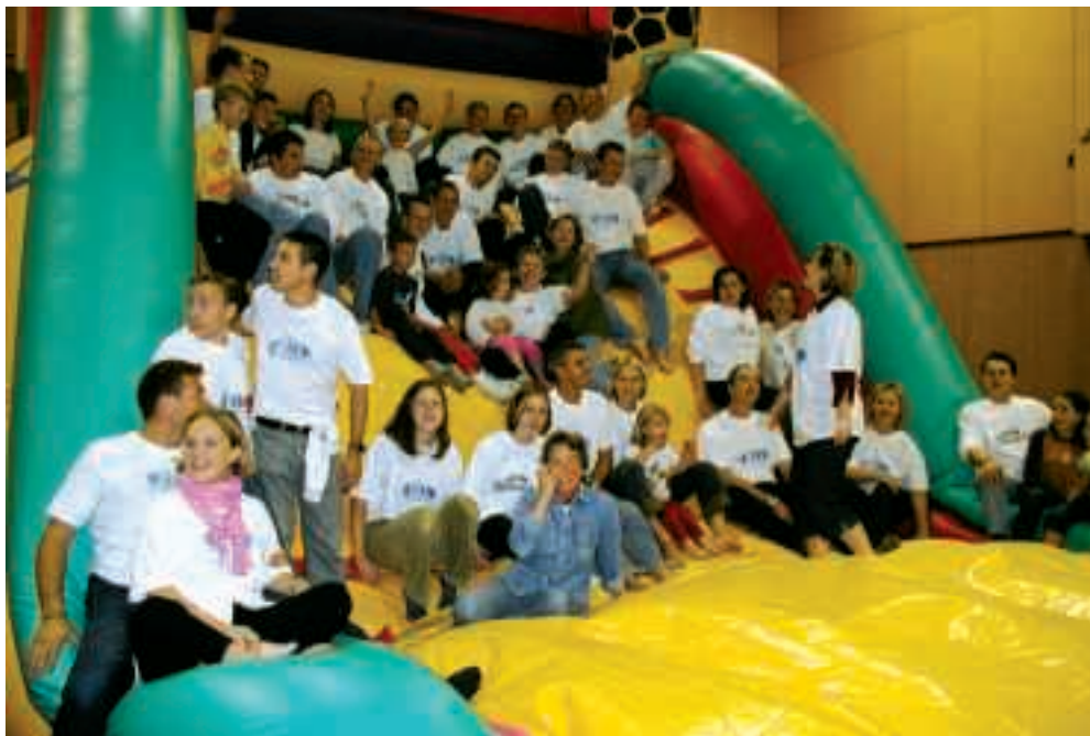
Photo souvenir du premier "C'Gonflé" de 2002 : l'un des premiers succès de la toute jeune association.