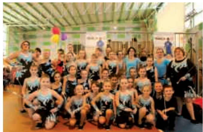
Ci-dessus : Les "Demoiselles d'Equedreville" lors de cette édition 2011 du Téléthon. À gauche : Le groupe de rock malouin "Le Pied de la pompe", qui s'est donné à fond pour l'action caritative "Les Rockeurs ont du cœur".