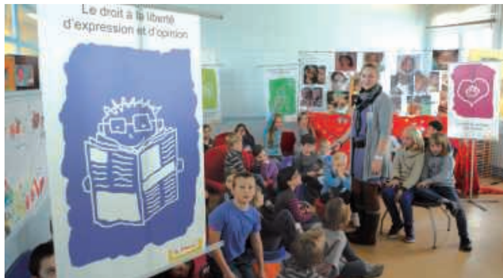
Le 24 novembre, après le spectacle "Tu peux compter sur tes dix droits", les enfants ont débattu et exprimé leur opinion.

Du 21 au 25 novembre, l'ex école Guérault accueillait la toute première édition de la "Semaine de l'Enfance". Expositions, ateliers, spectacles, débats et concours d'affiches ont rythmé ce temps fort dédié aux enfants et aux familles, qui s'inscrit dans un ambitieux projet d'éducation populaire.