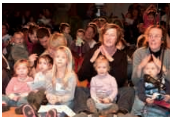
Le 15 décembre : goûter, chants et comptines de Noël pour les 0-3 ans fréquentant les accueils "Petite enfance" de la ville.