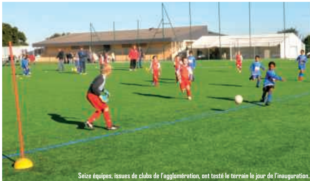
Seize équipes, issues de clubs de l'agglomération, ont testé le terrain le jour de l'inauguration.

Le stade Joseph Bocher possède désormais le premier terrain synthétique dédié au football de l'agglomération. Depuis la rentrée de septembre 2011, ce sont les enfants de l'école de football du FCEH qui l'utilisent, et l'enthousiasme est général.