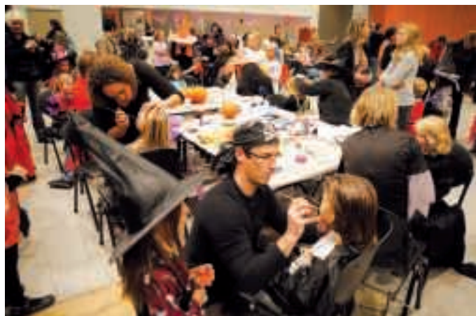
Avant son traditionnel Noël enchanté (voir en p. 5), le C'Jeune a aussi organisé une après-midi "C'Fluo" à l'Agora pour Halloween.

Et cet événement s'imposait rapidement comme LE rendez-vous à ne pas manquer sur l'agglomération. N'hésitant pas à s'associer aux anciens combattants (pour griller les saucisses) ou au comité des fêtes, le C'Jeune n'a cessé de proposer de nouvelles animations aux 3-12 ans et à leurs parents. "Nous avons toujours souhaité que les parents s'impliquent dans nos manifestations et