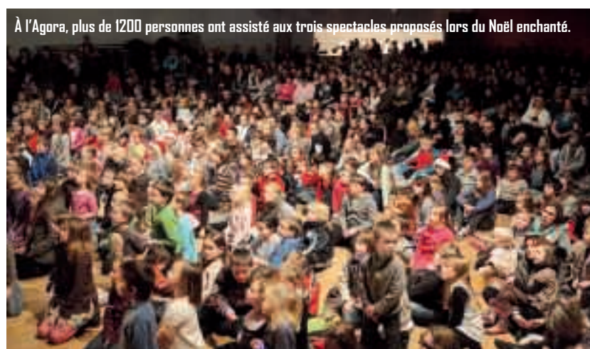
À l'Agora, plus de 1200 personnes ont assisté aux trois spectacles proposés lors du Noël enchanté.

Puis de multiples animations de Noël se sont égrenées avant la date fatidique... Les ateliers cuisine de fête à l'EHPAD, le fameux et très prisé Noël enchanté du C'Jeune et du comité des fêtes, le repas de Noël de l'EHPAD, le spectacle du pôle enfance, le repas de Noël dans les restaurants scolaires, la soirée de fin d'année des maisons de quartier et la visite du père Noël en personne aux bébés nageurs du centre aquatique... La symphonie de Noël était cette année... fantastique !