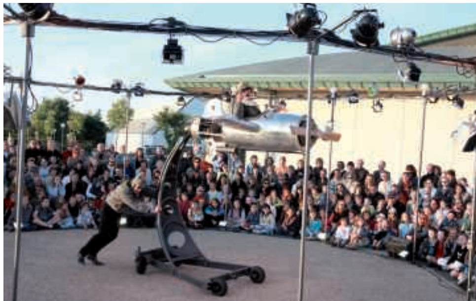
Les manifestations culturelles mises en place par la Ville sont accessibles à tous. Ainsi, lors des "Rendez-vous du mardi" (festival des arts de la rue), le service culturel accueille des groupes de personnes en situation de handicap.

La Ville a mis en place au CCAS une conseillère auprès de personnes âgées et/ou vivant un handicap ainsi qu'un service de maintien à domicile et un réseau de bénévoles effectuant des visites à domicile et ac-